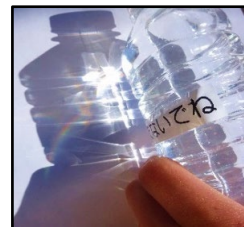
晴れた日は外に出て、太陽光とペットボトルに入った水でも虹をつくります。