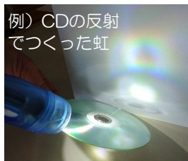
例) CDの反射でつくった虹